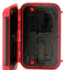
*Memory card case