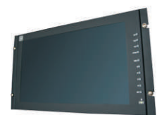
AC170WR: Kit montaje rack 19"

La información contenida en este documento esta sujeta a cambios