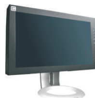
CA-PE15-17: Pie de sobremesa