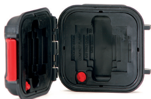
*Memory card case